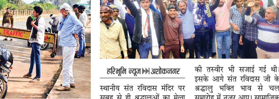
अशोकनगर

स्थानीय संत रविदास मंदिर पर सुबह से ही श्रद्धालुओं का मेला लगा रहा। यहां श्रद्धालुओं ने मंदिर में पूजा अर्चना कर आरती की और उनके द्वारा मानवता की सेवा के लिए दिए गए संदेश पर चर्चा की। दोपहर 12:00 बजे से चल समारोह निकाला गया, जिसमें श्रद्धालुओं ने बड़ी संख्या में भाग लिया। नांचते गाते हुए श्रद्धालु शहर के विभिन्न मार्गों से निकले। चल समारोह में संत रविदास जी