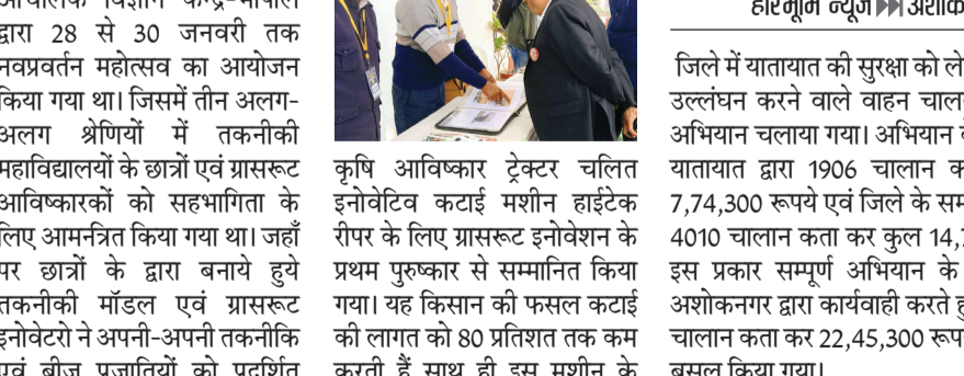
हरिभूमि न्यूज। अशोकनगर

वार्डों को सदैव रास्ता देने, नाबालिक बच्चों को वाहन न चलाने देने, यात्री वाहनों में ओवरलोडिंग न करने, वाहन चलाते समय मोबाइल का प्रयोग न करने, बिना वैध लायसेंस के कोई भी वाहन न चलाने जाने आदि यातायात के नियमों की जानकारी दी गयी एवं सभी आने जाने वाले वाहनों जैसे ट्रेक्टर-ट्रॉली, ट्रक, कार, व डंपर व अन्य वाहनों पर रडिगम रिफ्लेक्टर लगाया गया जिससे दुर्घटना न हो एवं यातायात नियमों का पालन करने की शपथ दिलाई गई।