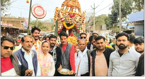
हरिभूमि न्यूज। आरोन

संत शिरोमणि गुरु रविदास जी महाराज की जयंती नगर आरोन में श्रद्धा, आस्था और उल्लास के साथ बड़े ही धूमधाम से मनाई गई। इस पावन अवसर पर नगर में भव्य शोभायात्रा का आयोजन किया गया, जिसमें समाज के वरिष्ठजन, युवा, महिलाएं एवं बच्चे बड़ी संख्या में शामिल हुए। शोभायात्रा नगर के प्रमुख मार्गों से होकर निकली गई, जहां नागरिकों द्वारा जगह-जगह पुष्पवर्षा कर भव्य स्वागत किया गया। शोभायात्रा के दौरान गुरु रविदास जी महाराज के जीवन, विचारों एवं उपदेशों का स्मरण करते हुए उनके अमर संदेश "मन चंगा तो कठौती में गंगा" को जन-जन तक पहुंचाया गया। वक्ताओं ने अपने संबोधन में कहा कि संत रविदास जी ने समाज को समानता, प्रेम, करुणा, भाईचारे और सामाजिक समरसता का मार्ग दिखाया। उनके विचार आज भी प्रासंगिक हैं और मानवता के लिए प्रेरणास्रोत बने हुए हैं। भव्य शोभायात्रा में ढोल-गाइनों की गूंज, भजन-कीर्तन और जयकारों से संपूर्ण नगर भक्तिमय वातावरण में सराबोर हो गया। श्रद्धालु गुरु रविदास जी की झोंकी के साथ चलते हुए भक्ति गीतों पर झूमते नजर आए। पूरे मार्ग में धार्मिक और सांस्कृतिक उत्साह देखने को मिला। कार्यक्रम के अंत में सामूहिक आरती का आयोजन किया गया, जिसके पश्चात प्रसादी वितरण कर कार्यक्रम का समापन किया गया।