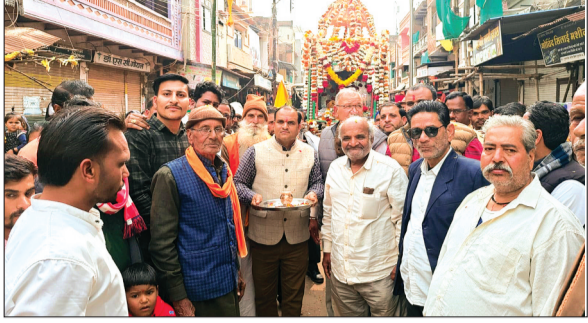
मन चंगा तो कठौती में गंगा

संत शिरोमणि गुरु रविदास जी महाराज की जयंती नगर आरोन में श्रद्धा, आस्था और उल्लास के साथ बड़े ही धूमधाम से मनाई गई। इस पावन अवसर पर नगर में भव्य शोभायात्रा का आयोजन किया गया, जिसमें समाज के वरिष्ठजन, युवा, महिलाएं एवं बच्चे बड़ी संख्या में शामिल हुए। शोभायात्रा नगर के प्रमुख मार्गों से होकर निकली गई, जहां नागरिकों द्वारा जगह-जगह पुष्पवर्षा कर भव्य स्वागत किया गया। शोभायात्रा के दौरान गुरु रविदास जी महाराज के जीवन, विचारों एवं उपदेशों का स्मरण करते हुए उनके अमर संदेश "मन चंगा तो कठौती में गंगा" को जन-जन तक पहुंचाया गया। वक्ताओं ने अपने संबोधन में कहा कि संत रविदास जी ने समाज को समानता, प्रेम, करुणा, भाईचारे और सामाजिक समरसता का मार्ग दिखाया। उनके विचार आज भी प्रासंगिक हैं और मानवता के लिए प्रेरणास्रोत बने हुए हैं। भव्य शोभायात्रा में ढोल-गाइनों की गूंज, भजन-कीर्तन और जयकारों से संपूर्ण नगर भक्तिमय वातावरण में सराबोर हो गया। श्रद्धालु गुरु रविदास जी की झोंकी के साथ चलते हुए भक्ति गीतों पर झूमते नजर आए। पूरे मार्ग में धार्मिक और सांस्कृतिक उत्साह देखने को मिला। कार्यक्रम के अंत में सामूहिक आरती का आयोजन किया गया, जिसके पश्चात प्रसादी वितरण कर कार्यक्रम का समापन किया गया।